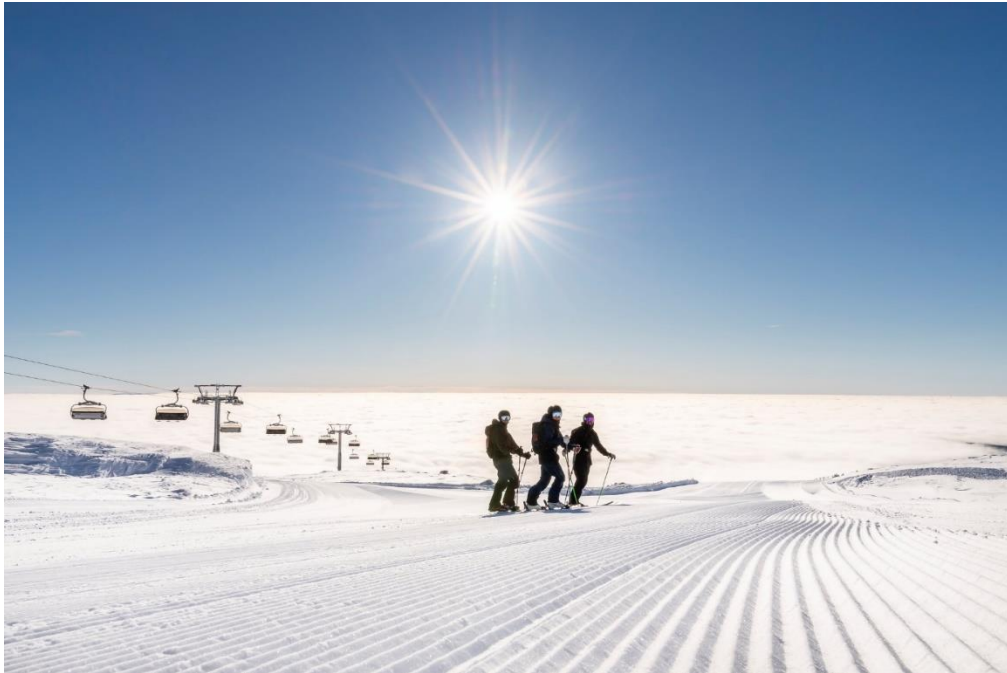
Helge Bonden Destinasjonssjef, SkiStar Trysil

SkiStar Trysil ønsker dere alle velkommen til en ny skisesong i Trysil!