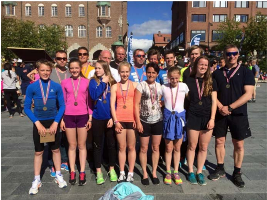
Fornøyde Stadsbygd løpere i Østersund på St. Olavsloppet's siste dag i juni 2015.