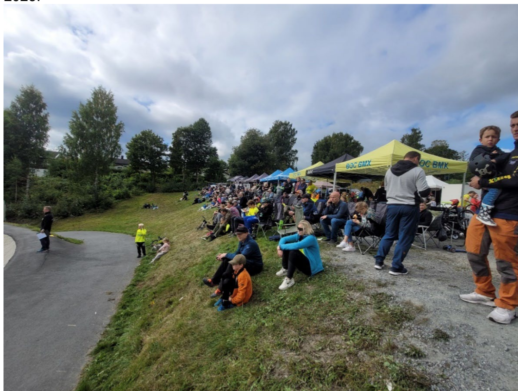
Bilde 1: God stemning på «tribunen» under NorgesCup på hjemmebane

Det har vært et svært godt engasjement i foreldregruppen også i 2022. Dette gjelder alt fra dugnad på banen før løpene til gjennomføring av dugnader som har gitt ekstra midler til gruppen og kioskarbeid. Gruppestyret ønsker å takke foreldregruppen og vi ser frem til like god innsats i 2023.