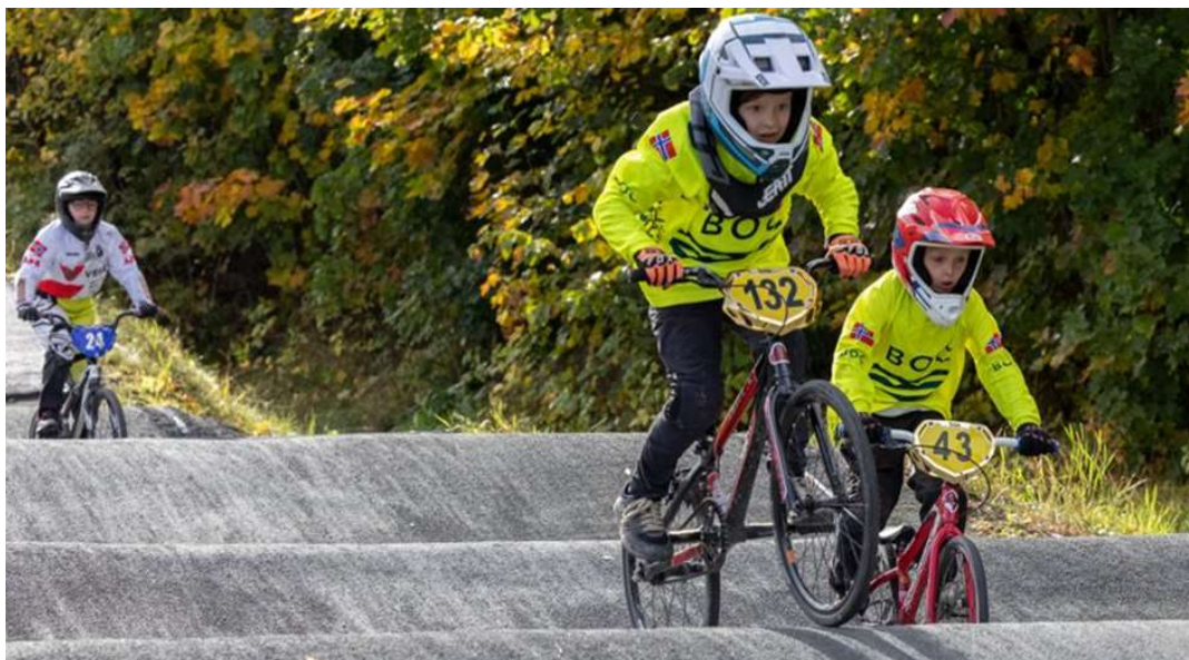
Bilde 1: BMX-løp på hjemmebane

Det har vært et svært godt engasjement i foreldregruppen i 2021. Dette gjelder alt fra dugnad på banen før NC-cup til gjennomføring av dugnader som har gitt ekstra midler til gruppen og kioskarbeid. Styret ønsker å takke foreldregruppen og vi ser frem til like god innsats i 2022.